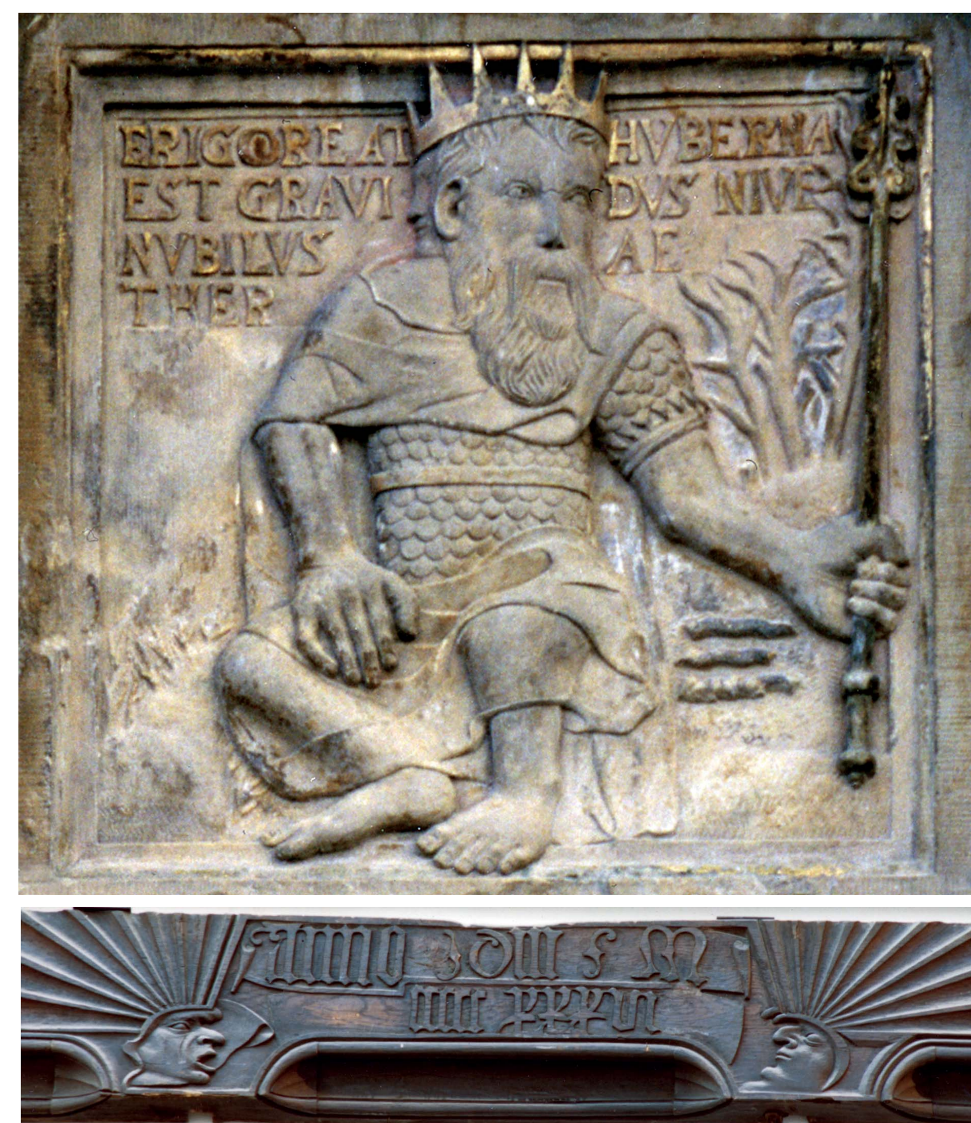
HAUSINSCHRIFTEN IN BRAUNSCHWEIG UND HILDESHEIM

Nach der Eroberung durch Alexander den Großen wurde Ägypten zu einem wichtigen Einwanderungsland nicht nur für Griechen, sondern auch für Juden. Eine wichtige jüdische Gemeinde war die mittelägyptische Stadt Heracleopolis. Aus Papyri wissen wir, dass diese Gemeinde eine gewisse Selbständigkeit hatte. Jährlich wurden Gemeindevorsteher gewählt, die Archonten, und diese waren befugt, unter Juden Recht zu sprechen. Aus dieser Gemeinde haben sich 20 Papyri erhalten, die die juristische Tätigkeit der Archonten beleuchten. Diese und andere Papyri werden im Akademienprogramm im Projekt „Papyrusurkunden“ der Nordrhein-Westfälischen Akademie der Wissenschaften erforscht.