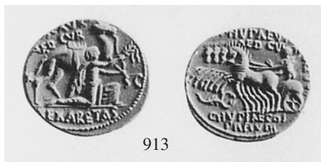
Abb. 4 Römische Münzmeister-Prägungen der späten Republik: a) Silberdenar des Q. Caepio Brutus, des späteren Caesar- mörders (60 v. Chr.). Vs.: Haupt der Li- bertas, LIBERTAS; Rs.: der Consul L. Iunius Brutus (509 v. Chr.) mit zwei Li- koren und einem Amtdiener, BRVTVS (Anspie- lung auf den Repu- blikgründer und Na- mensträger Brutus). – (ebd. p.150, nr.906, pl.25). b) Silberdenar der M. Aemilius Scaurus und P. Plautius Hyp- saeus (58 v. Chr.). Vs.: Nabatäer-König Aretas kniend, ein Kamel führend, M. SCAVR(us) AED(ilis) CVR(ulis) – EX S(enatus) C(onsulto), REX ARETAS; Rs.: Jupi- ter auf Quadriga, P.HYPSAEVS AED(ilis) CVR(ulis) – C.HYPSAEOS PREIVER(num ce- pit) (Anspielungen auf den Sieg des M. Aemilius Scaurus über Aretas, 62 v. Chr., und auf den Triumph des Consuls C. Plautius nach der Einnahme der latini- schen Stadt Priver- num, 329 v. Chr.). – (ebd. p.152, nr.913, pl.25)

nach der Darstellung des Ptolemaios (Issos: Arrianos, Anabasis 2, 7–12; Gaugamela: 3, 8–15); die Schlacht von Cannae bei Livius (22, 43–61), die römischen Bürgerkriegsschlachten zwischen Caesar und Pompeius (Pharsalus: Caesar, Bellum civile 3, 84–99) oder zwischen Flavianern und Vitellianern (Bedriacum: Tacitus, Historiae 3, 15–35). Bildhafte Anschaulichkeit und Vergegenwärtigung, die den Hörer oder Leser zum Augenzeugen macht (ἐνάργεια evidentia ), eine optische Qualität also, ist denn auch das, was die rhetorische Theorie von der Erzählung von Sachverhalten (διήγησις narratio ) verlangt. Die eindringliche, plastische Klarheit kann zwar ins Pathetische oder Dramatische entgleiten, aber widerstrebt nebulöser Formlosigkeit; und schon unanschauliche Reflexionen und Hintergrundinformationen werden in der Geschichtsschreibung in eingelegte Exkurse oder Reden verwiesen.