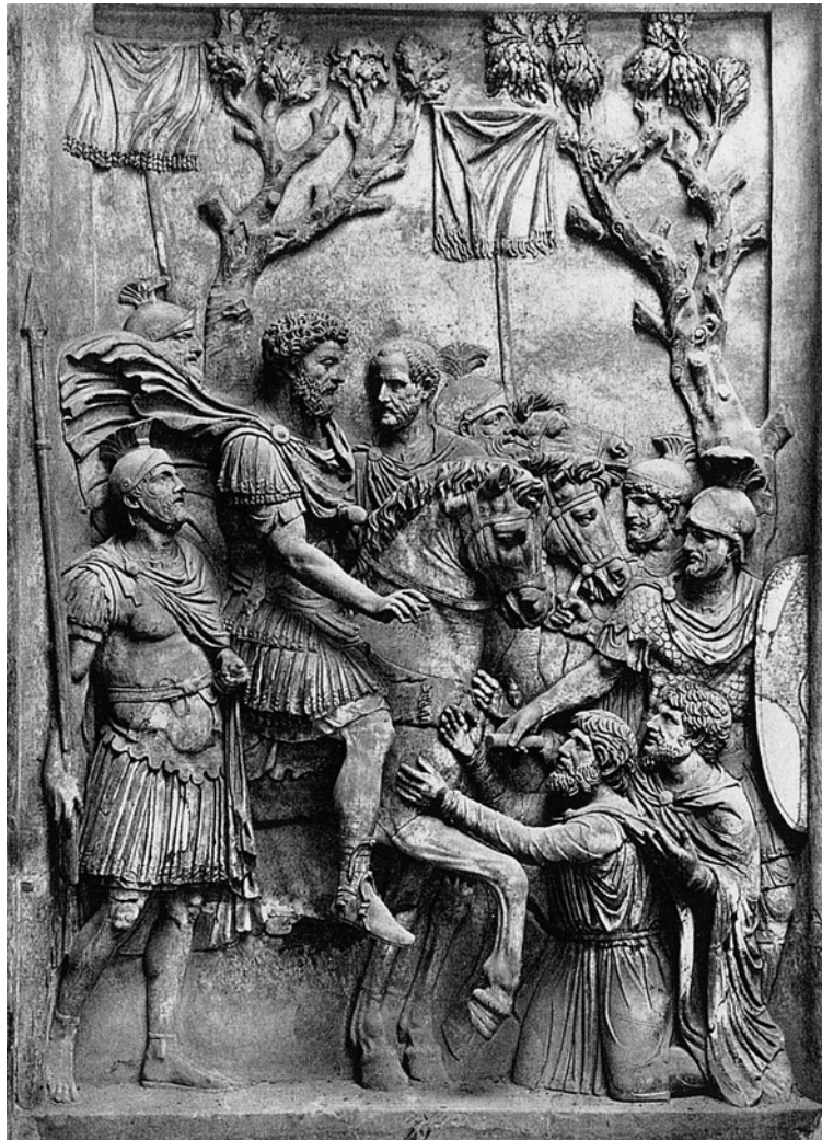
Abb. 5 Kaiser Marc Aurel nimmt die Unterwerfung der Markomanen entgegen (176 n. Chr.). Marmorrelief von einem Triumphbogen des Kaisers, Rom, Palazzo dei Conservatori