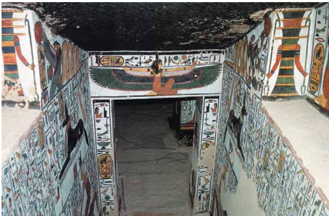
Geflügelte Ma'at, aus dem Grab der Königin Nefertari in Theben (19. Dyn., um 1250 v. Chr.)

gen. Das ist in allererster Linie eine Sache des Gedächtnisses, nicht nur des sozialen Gedächtnisses, sondern vor allem auch des individuellen Gedächtnisses, in das sich die Gesellschaft mit ihren Normen und Ansprüchen einschreibt.